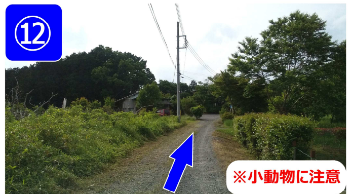
ジャリ道をそのまま進んで下さい。