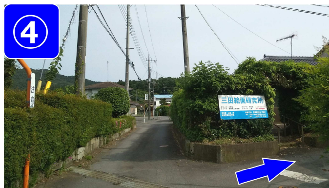
看板の手前で右折します。