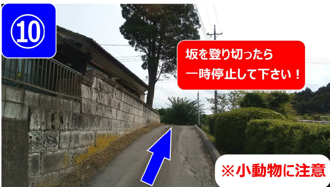
坂を進んで、登り切ったら一時停止して下さい。