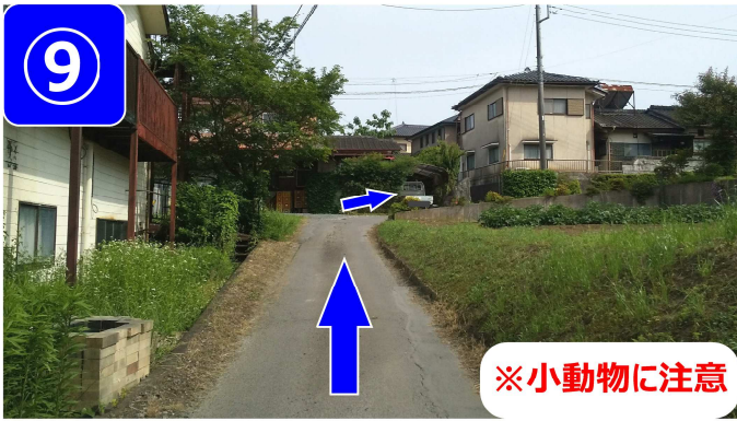
緩い坂をそのまま進み、右にカーブします。