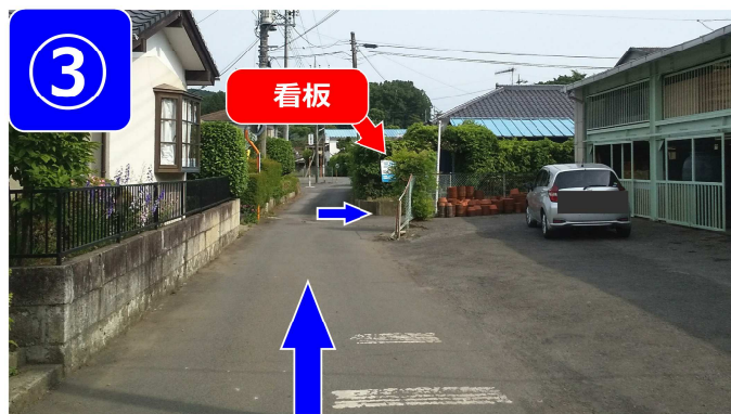
細い路地に入って看板の所まで進みます。