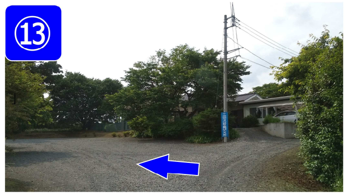
手前の駐車場に駐車して下さい。