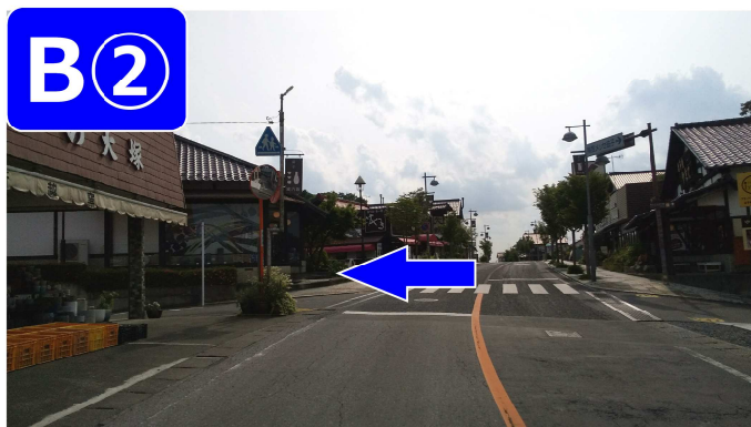
カーブミラーの先を左折します。