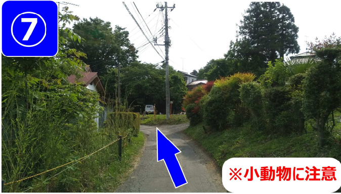
対向車に注意してゆっくりお進み下さい。