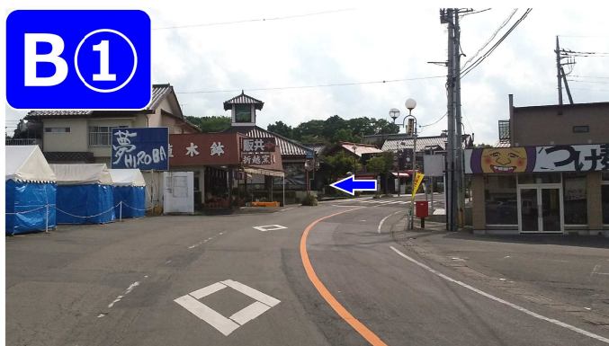
城内坂（東側から入る場合）