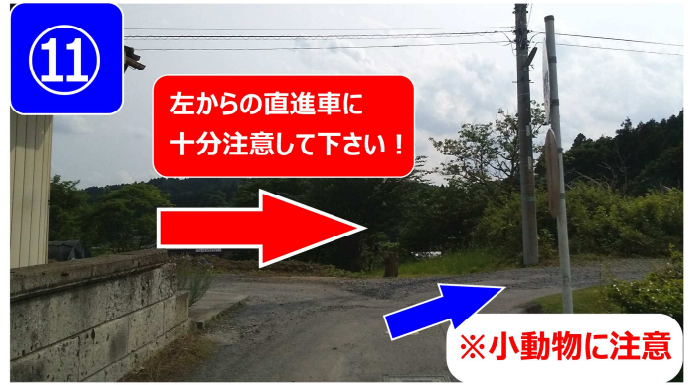
一時停止し、左からの直進車に十分注意しながら右折してジャリ道に入ります。