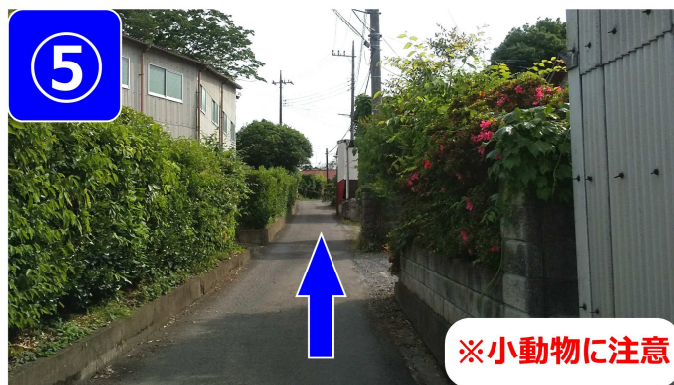
道なりに70m進んで下さい。