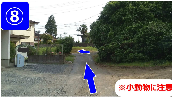
左にカーブしながら緩い坂に入ります。