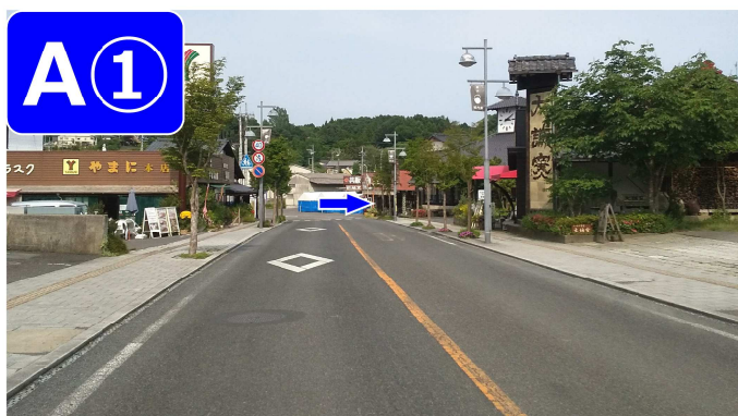
城内坂（西側から入る場合）